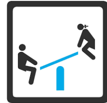
Giochi non sorvegliati