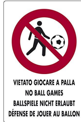
Vietato Giocare a palla