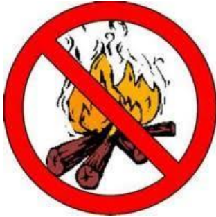
Vietato accendere Fuochi